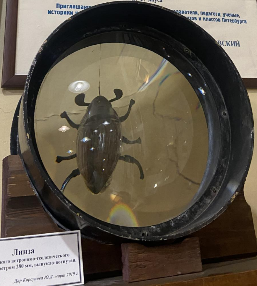
Линза от оптического астрономо-геодезического прибора, диаметром 280 мм, выпукло-вогнутая. Дар Корсунова Ю.Д. март 2019 г.